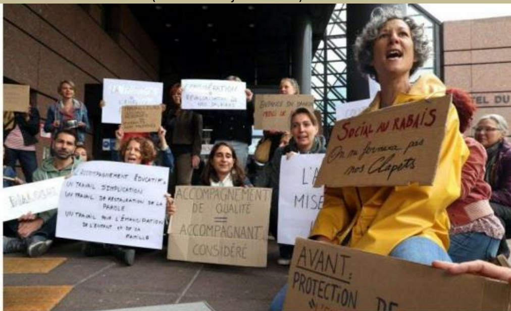
Près de la moitié des travailleurs sociaux de l'AEMO (67) ont manifesté, vendredi matin, devant la CEA.

Une trentaine de personnels de l'Action éducative à domicile et du Service d'action éducative en milieu ouvert, soit près de la moitié des 78 salariés du Service AED-AEMO 67, ont manifesté vendredi 1 er juillet devant la Communauté européenne d'Alsace pour une meilleure reconnaissance de leurs métiers. Une délégation de ces personnels, employés par l'ARSEA (Association régionale spécialisée d'action sociale d'éducation et d'animation), a été reçue par un représentant de la CEA en charge de la protection de l'enfance. La collectivité finance le prix d'une journée d'AEMO, fixée à 7,04 euros par enfant, alors qu'au niveau national, « le prix habituel est compris entre 8 et 20 euros par jour », indique un représentant du collectif « Rejoignez l'AEMO en lutte ».